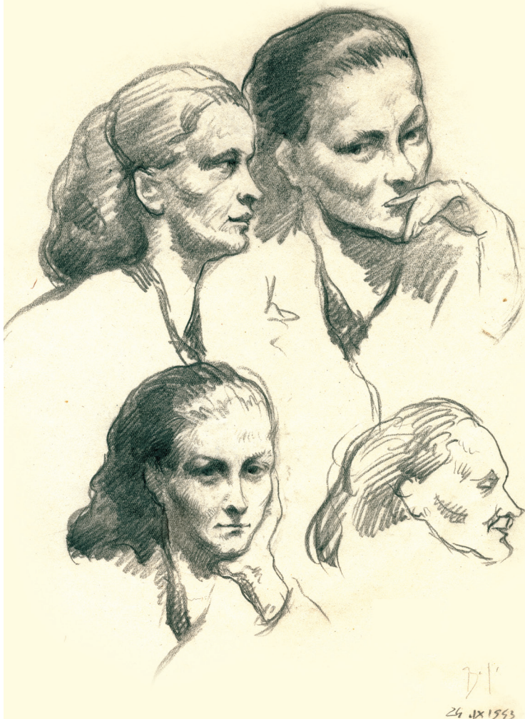
Risba Božidarja Jakca, Deleгатke 1. kongresa SPŽZ

Društvo Dobrníč, Združenje borcev za vrednote NOB Trebnje in Kulturno turistično društvo Dobrníč